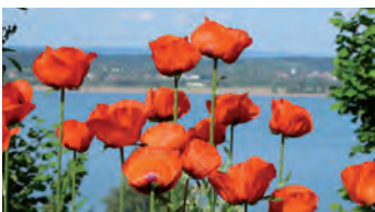
Garten-Rendezvous am Untersee