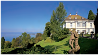
Schloss & Park Arenenberg