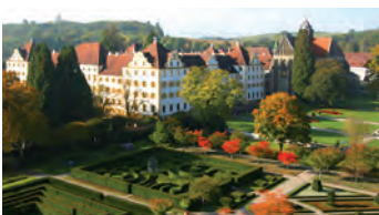
Kloster & Schloss Salem