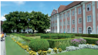
Neues Schloss Meersburg